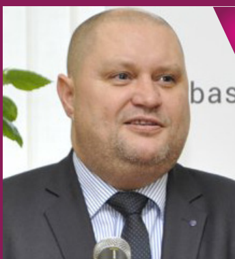
Robert Kirnag, Ambasadorul Slovaciei în R. Moldova:

„Am creat acest raport, deoarece credem că este necesar ca autoritățile locale să înțeleagă cum poate fi consolidată încrederea cetățenilor în ceea ce fac ele. Nu există nicio localitate cu date ideale. Nu există niciun model absolut, pentru că fiecare localitate are performanțele și lipsurile sale, iar obiectivul acestui raport este de a difuza practicile pozitive și de a promova ideea că, pentru a fi mai atractive pentru partenerii de dezvoltare, primăriile trebuie să dezvolte calitățile de a servi interesului public, de a fi transparente și a avea instrumente care să asigure credibilitatea cetățeanului. Fără aceste elemente, nu poate exista progres la nivel național”.