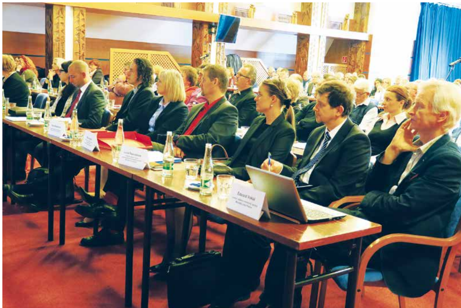
Pohľad na účastníkov odbornej konferencie k problematike bývania marginalizovaných komunít, ktorá bola jednou z prvých aktivít v rámci projektu Centrum sociálneho dialógu II.