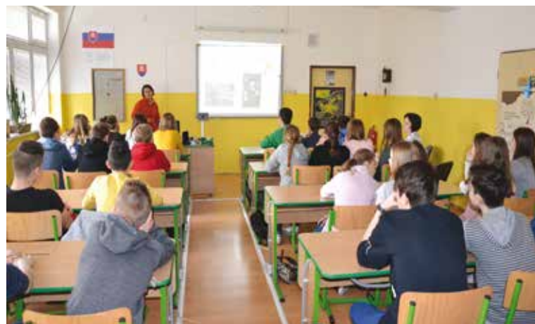
Prednáška o zelených strážcoch.