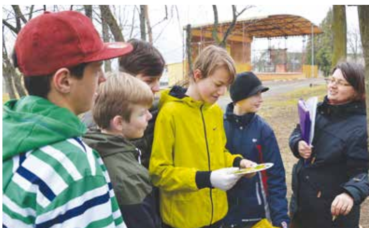
Vieš ktorý strom to je?