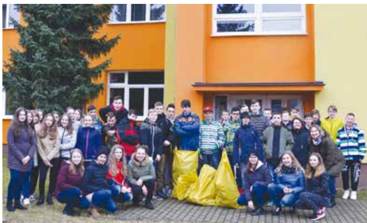
Žiaci z 8. A a 8. B vyzbierali 5 vriec odpadkov.

Park vznikol v 19. storočí a mal charakter anglického parku, postupne však prešiel viacerými zmenami. V parku sa nachádzal rokokový kaštieľ, ktorý bol postavený v prvej polovici 18. storočia. Okrem kaštieľa tu stáli aj hospodárske budovy. Parkom viedlo niekoľko ciest. Samostatnou cestou bola spojovacia cestička ku kostolu. Bol tu aj tzv. veľký parkový okruh, ktorý viedol takmer po obvode parku a spájal jeho najvzdialenejšie časti. Súčasne sprístupňoval najatraktívnejšie časti okolo jazierka, grotty až po ovocný sad a vracal sa späť k východnému