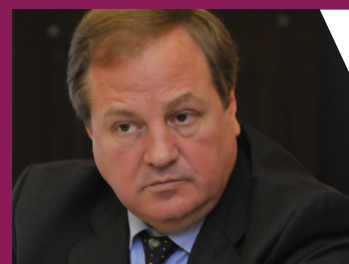
Mihai Manoli, fost ministru al Finanțelor:

„Neregulile depistate de Curtea de Conturi reprezintă fraude”