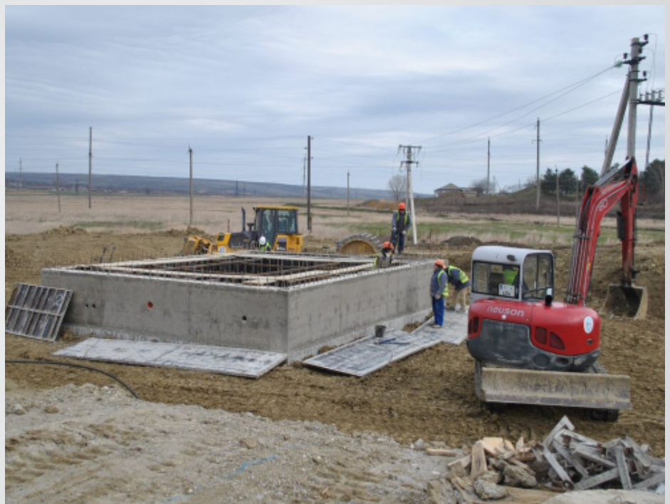
Construcția stației de epurare de la Telenești