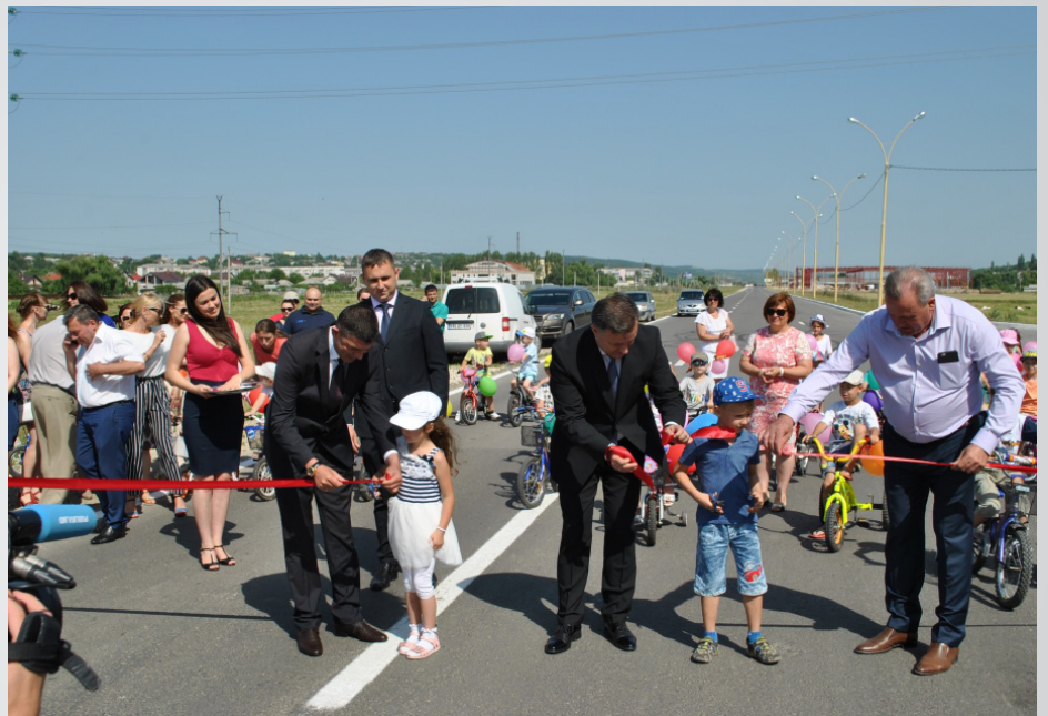
Drumul de ocolire a orașului Hâncești

care nu poate fi deocamdată promovat, până nu va fi realizată o nouă reformă administrativ-teritorială și vor fi trasate noile regiuni ale R. Moldova. O idee discutată acum la minister este și alocarea banilor din FNDR pentru plata cotei administrațiilor publice locale ce implementează proiecte transfrontaliere.