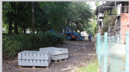
Фото міжбудинкового проїзду за адресою вул. Руданського 10-А