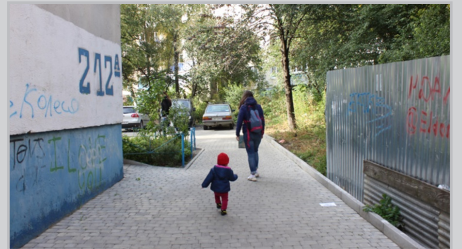
Фото міжбудинкового проїзду за адресою вул. Головна 212-А, Б

житлово-комунального господарства було укладено 13 липня 2017 року, а вже 14-го всі кошти на ремонт було надіслано підряднику! Яка швидкість!