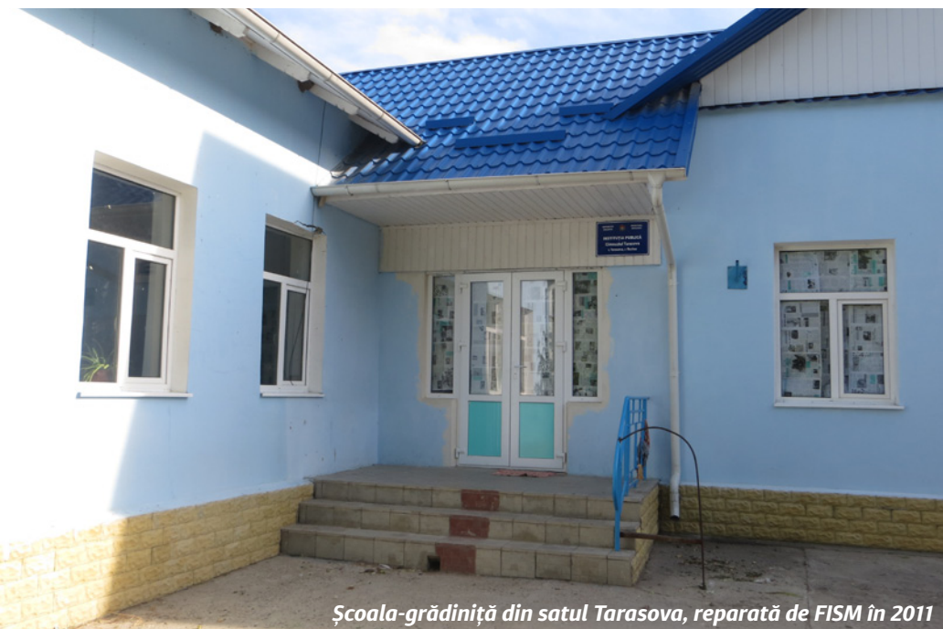
Școala-grădiniță din satul Tarasova, reparată de FISM în 2011

Decizia nr. 1/2 din 25 ianuarie 2017 au fost alocate conform destinației”. Președinta nu a concretizat cine anume și când a schimbat ferestrele și ușile și ce resurse au fost cheltuite efectiv în aceste scopuri.