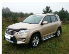
Toyota Rav 4, 2008 r. 6 300 € / 200 000 KM