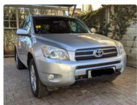
Toyota Rav 4, 2008 r. 9 100 € / 158 000 KM