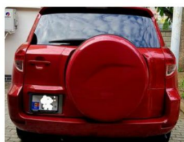
Toyota Rav 4, 2008 r. 9 300 € / 230 000 KM