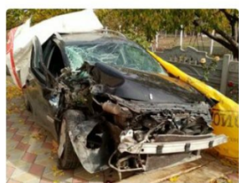
Toyota Rav 4, 2008 r. 3 350 € / 100 KM