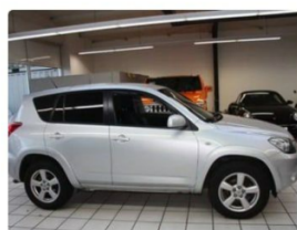
Toyota Rav 4, 2008 r. 7 000 €