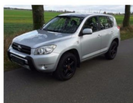
Toyota Rav 4, 2008 r. 6 500 €